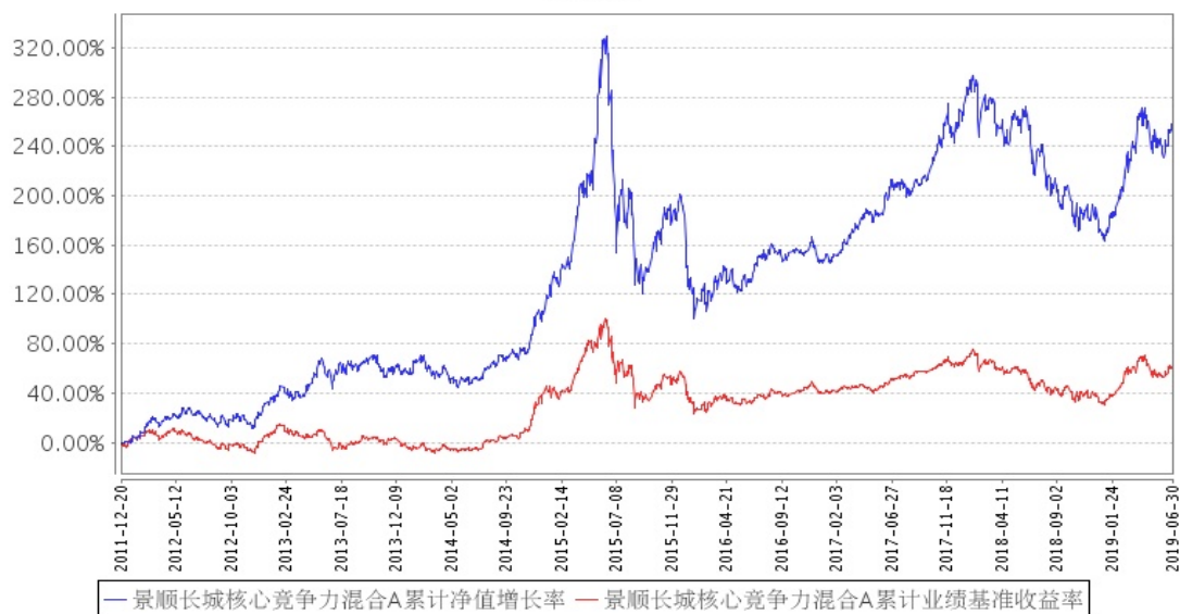
景顺长城核心竞争力混合A累计净值增长率与同期业绩比较基准收益率的历史走势对比图